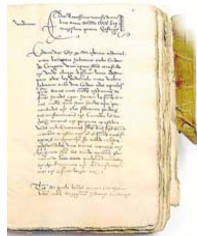
Arriba, tapas de guitarra romántica y española. A la izquierda, antiguo contrato de aprendizaje de un violero de Zaragoza.